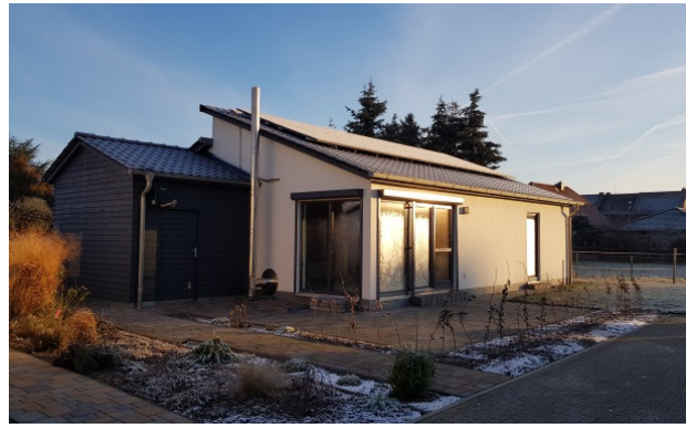
Vereinshaus, Ansicht von Südwest