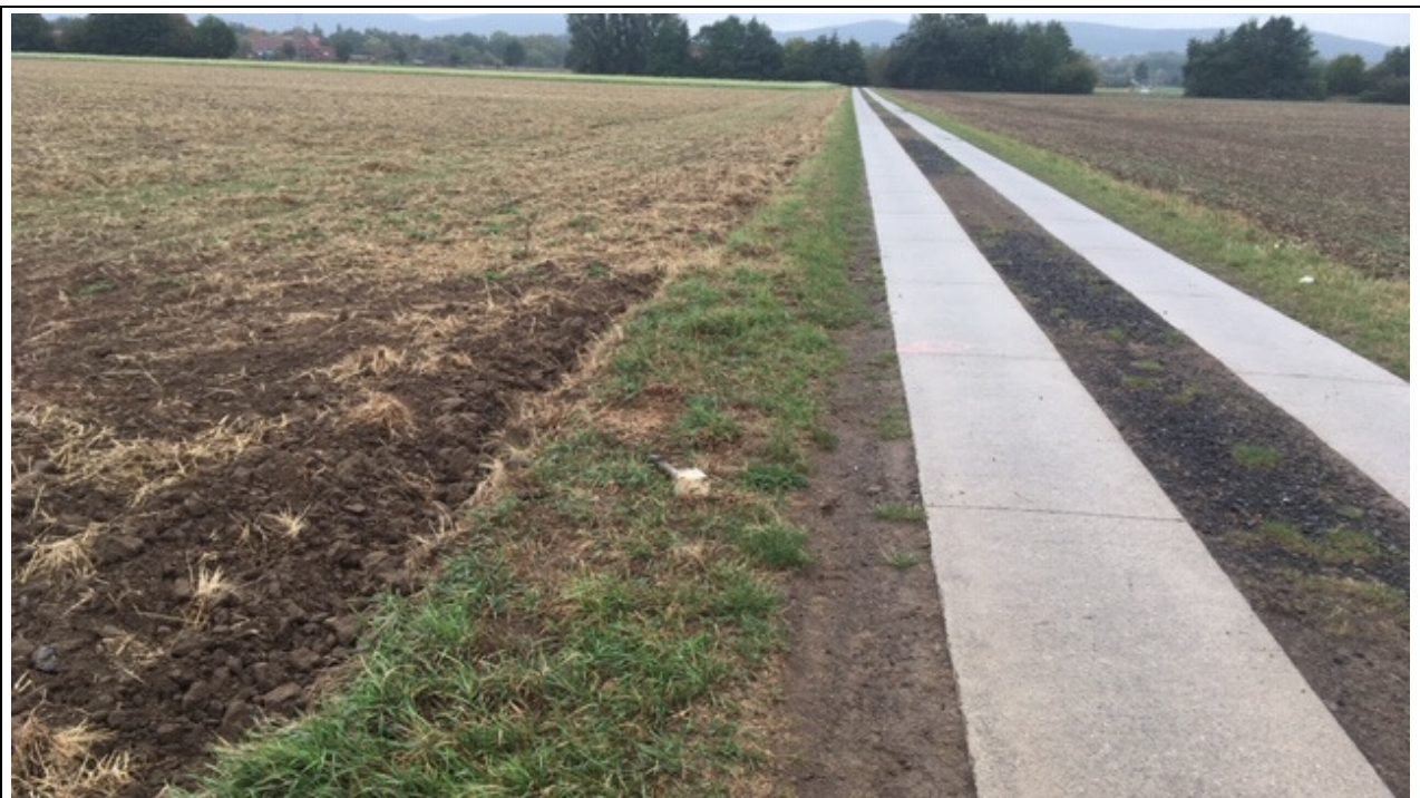
Oft sind Wegränder schmal und leisten für den Biotopverbund kaum einen Beitrag.