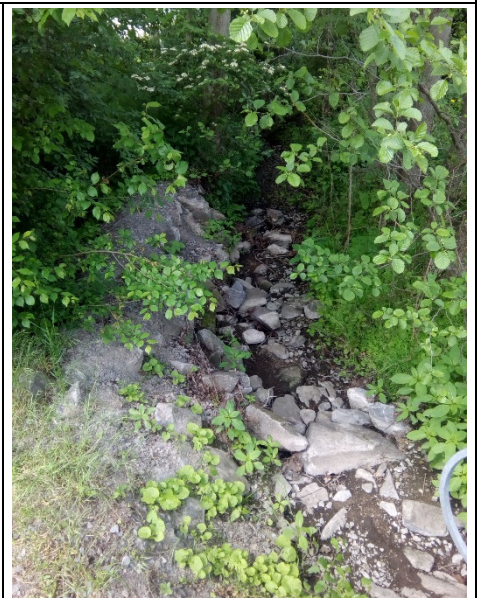
Aktueller Zustand vom Liethbach