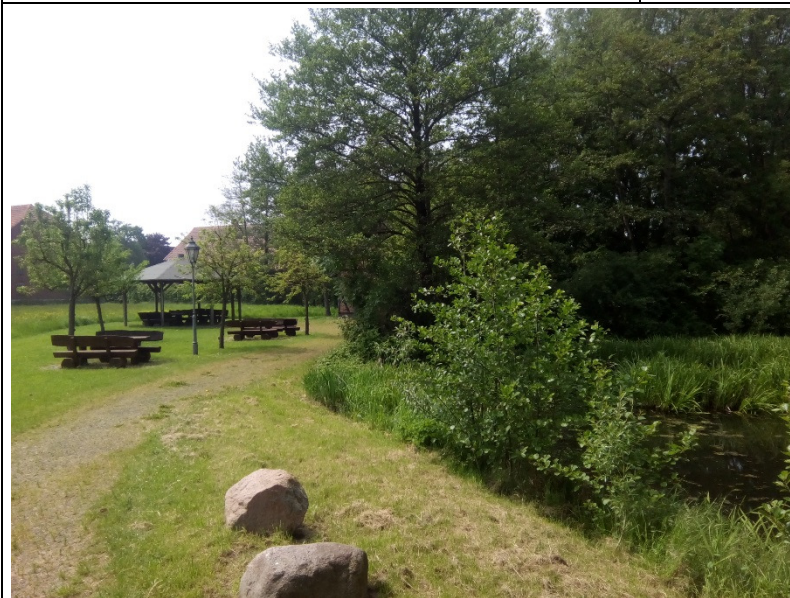
Aktueller Zustand vom Dorfteich und vom Aufenthaltsbereich