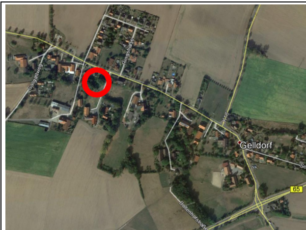
Luftbild von Gelldorf mit Lage des Teiches (roter Kreis)