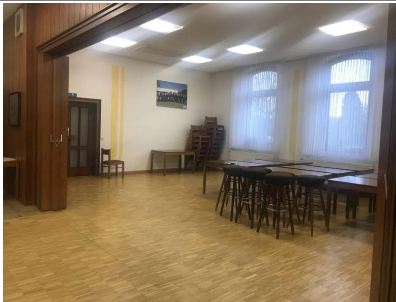
Der Parkettboden ist an einigen Stellen stark beschädigt. Er soll abgeschliffen und neu versiegelt werden, um die Lebensdauer zu verlängern.