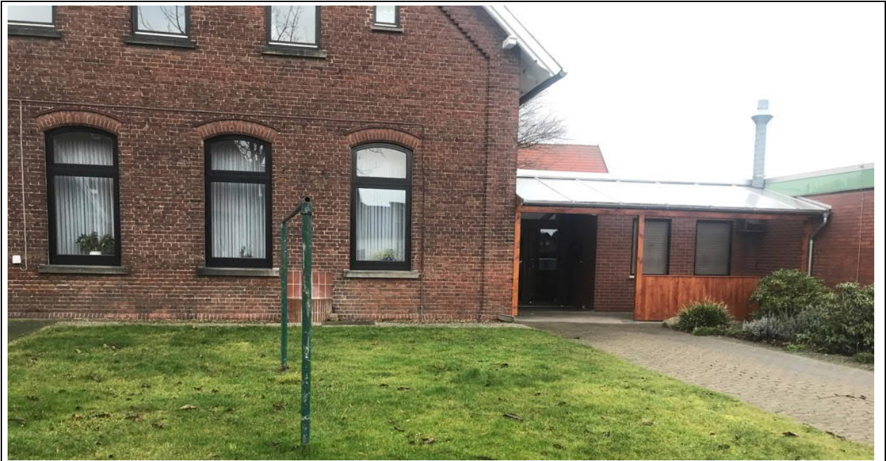
Blick auf das Dorfgemeinschaftshaus Scheie, rechts der Eingangsbereich. Durch den Austausch der Fenster am gesamten Gebäude soll der Energieverbrauch reduziert werden.