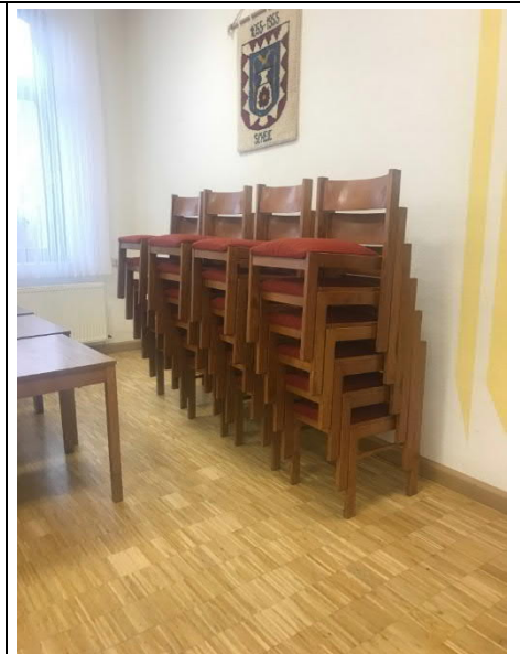
Die Bestuhlung soll erneut werden, um die Attraktivität des Dorfgemeinschaftshauses für Vereine und Externe zu steigern.