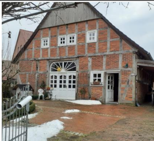
Nordseite, Blick von der Dorfstraße