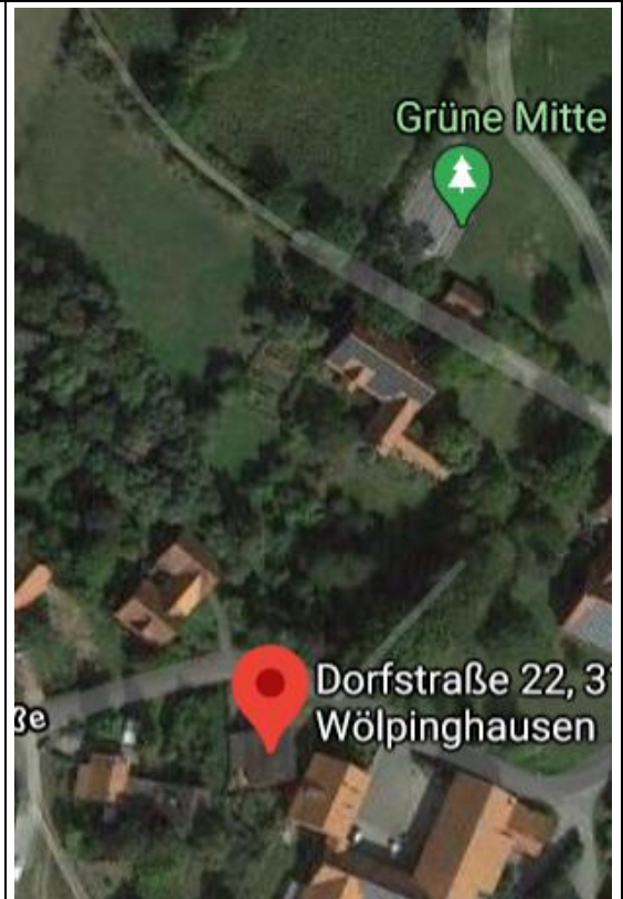
Es liegt unweit der „Grünen Mitte“ in Wölpinghausen