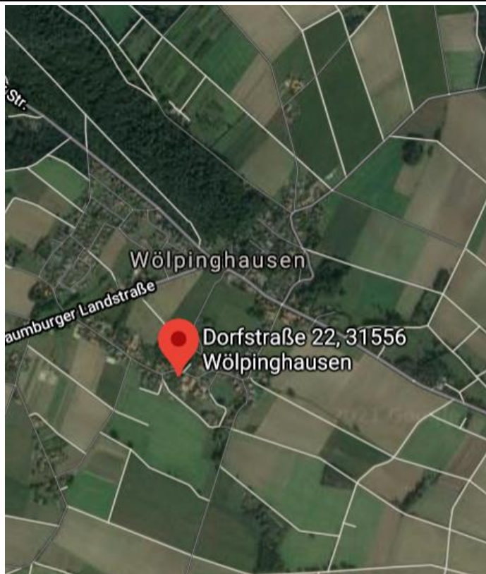
Das Fachwerkhaus in der Dorfstr. 22 (roter Kreis)