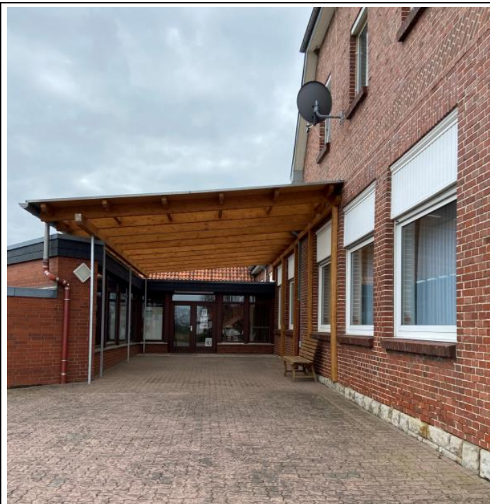
Blick auf das Dorfgemeinschaftshaus Cammer. Durch den Austausch der Fenster am gesamten Gebäude soll der Energieverbrauch reduziert werden.