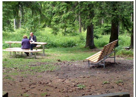
„Naturpark-Wanderwege“ zeichnen sich durch schöne Streckenführung, angenehme Wegebeläge, gute Wegweisung, bequeme Rastmöglichkeiten und klares Infomaterial aus.