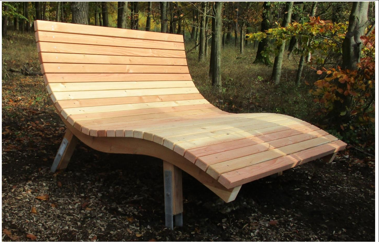
Waldsofa-Beispielfoto (Beispielfoto)