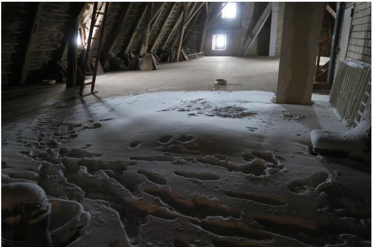
Schneeeintrag, Blick nach Westen