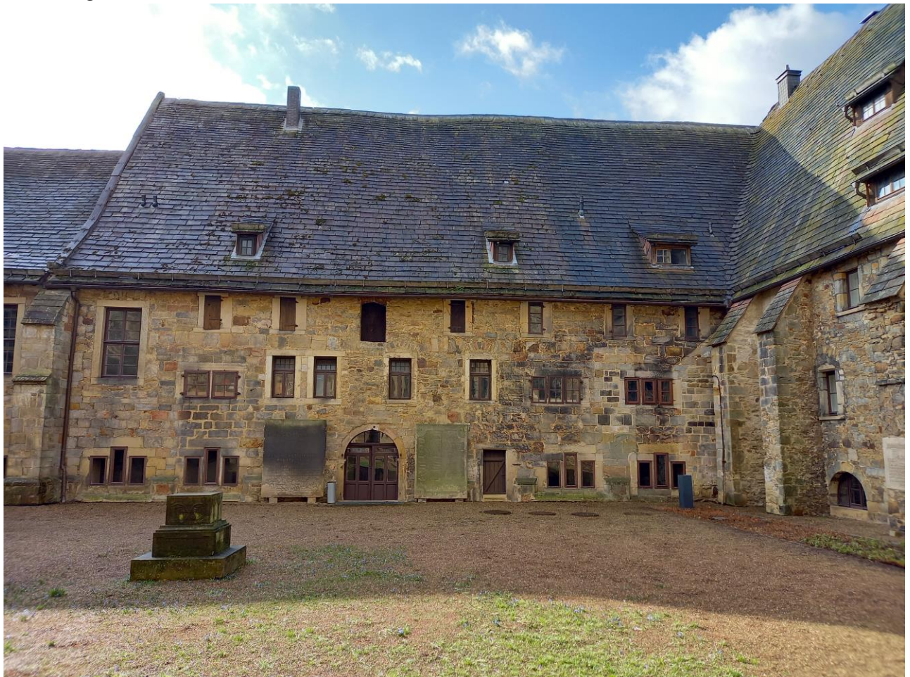
Nordansicht des Südflügels