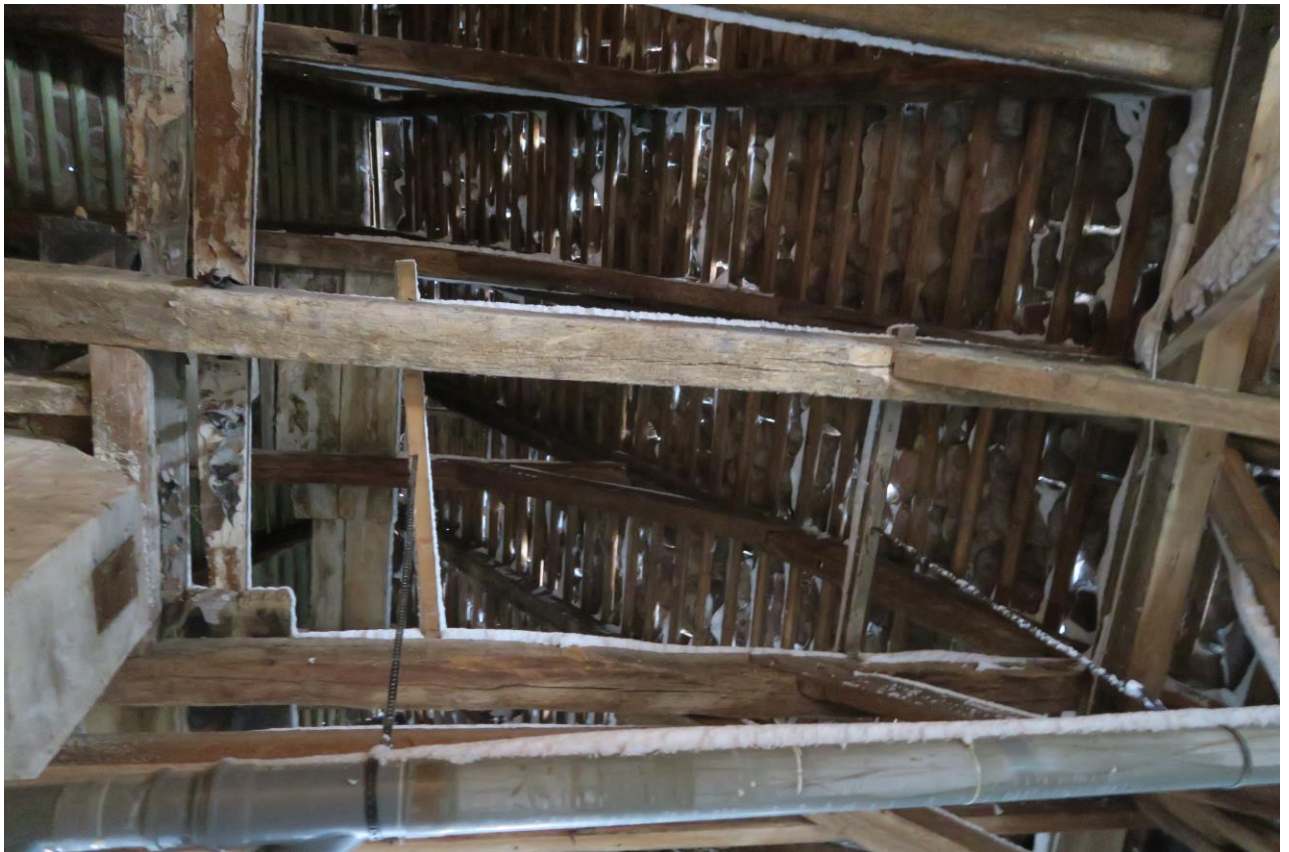
Sicht unter die undichten Platten