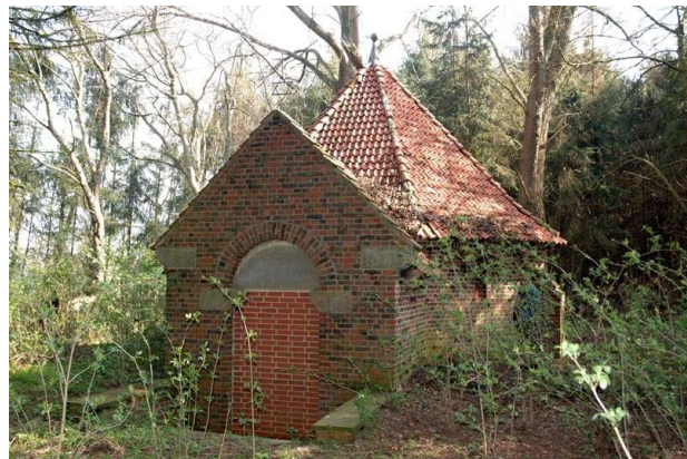
Ansicht von Südwesten