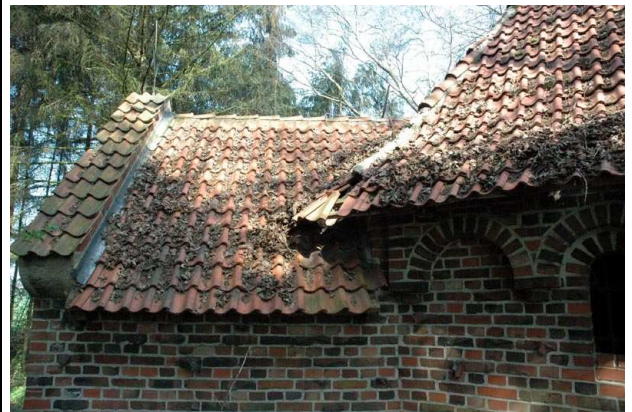
Ansicht v. Südosten: Dachschäden