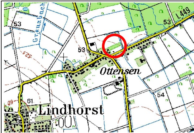
Topographische Karte 1:50.000 (Hrsg.: LGLN)