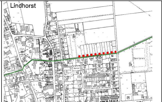
Rote Strichellinie: zu befestigende Strecke der Wiemannstraße (Dt. Grundkarte 1:5.000, Hrsg.: LGLN)