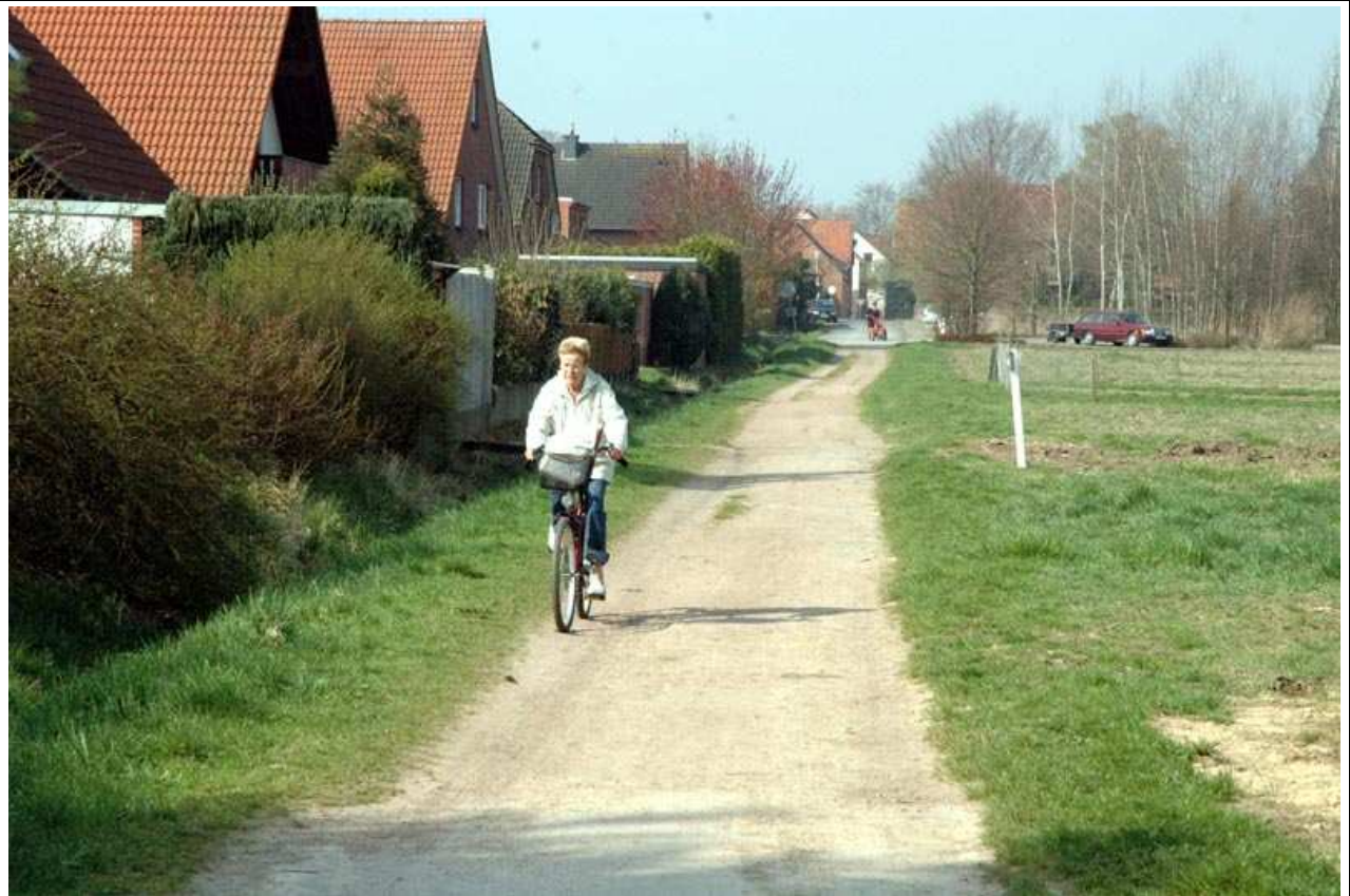
Wiemannstraße von Osten gesehen