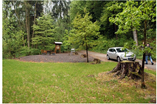
Rastplatz Sieben Eichen (Gem. Hülsede)