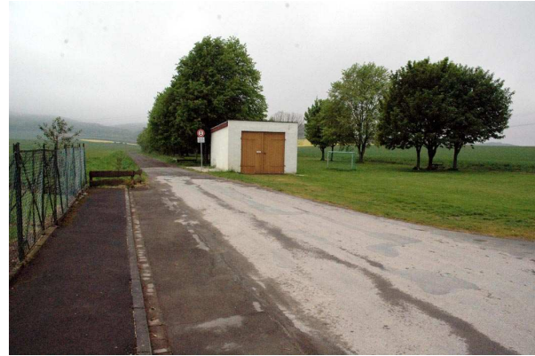
Fläche für den Wanderparkplatz Hülsede (Rasenfläche rechts) und Weg hinauf zum Süntel