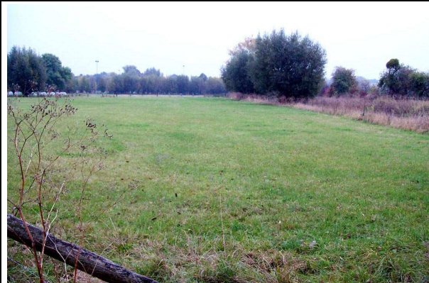
Künftige Streuobstwiese: Blick von der Aue nach Norden