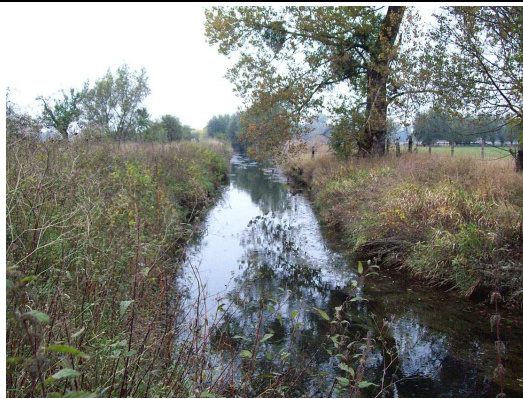
Die Bückeburger Aue (Blick nach SW)

Das Projektgebiet (roter Kreis) liegt im Naturpark Weserbergland und zählt somit zur Gebietskulisse der Richtlinie „N & L“. (Karte: LK Schaumburg, Untere Naturschutzbehörde; Kartengrundlage: TK 50, Hrsg.: LGLN)