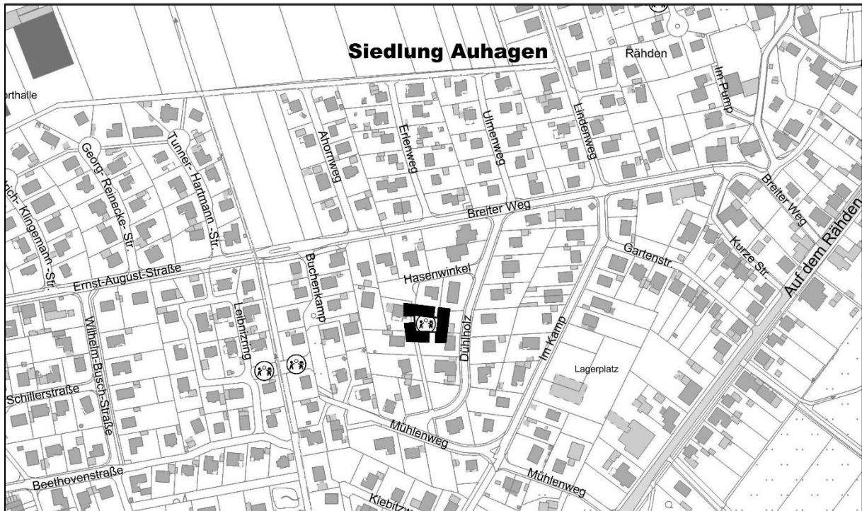
Kartengrundlage: Auszug aus der Amtlichen Karte (AK 5), M. 1:5.000, © GeoBasis-DE/LGLN (2025)