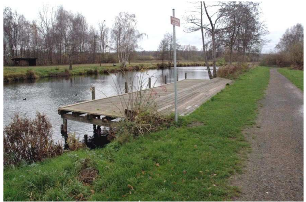
Hagenburger Kanal, Kanuanleger und Steinhuder- Meer-Rundweg