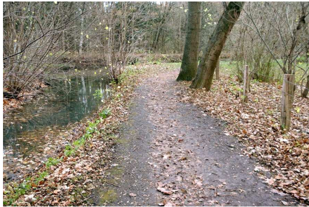
Zu behebende Gefahrenstelle am Radweg zw. Hagenburger Kanal und Moorgarten