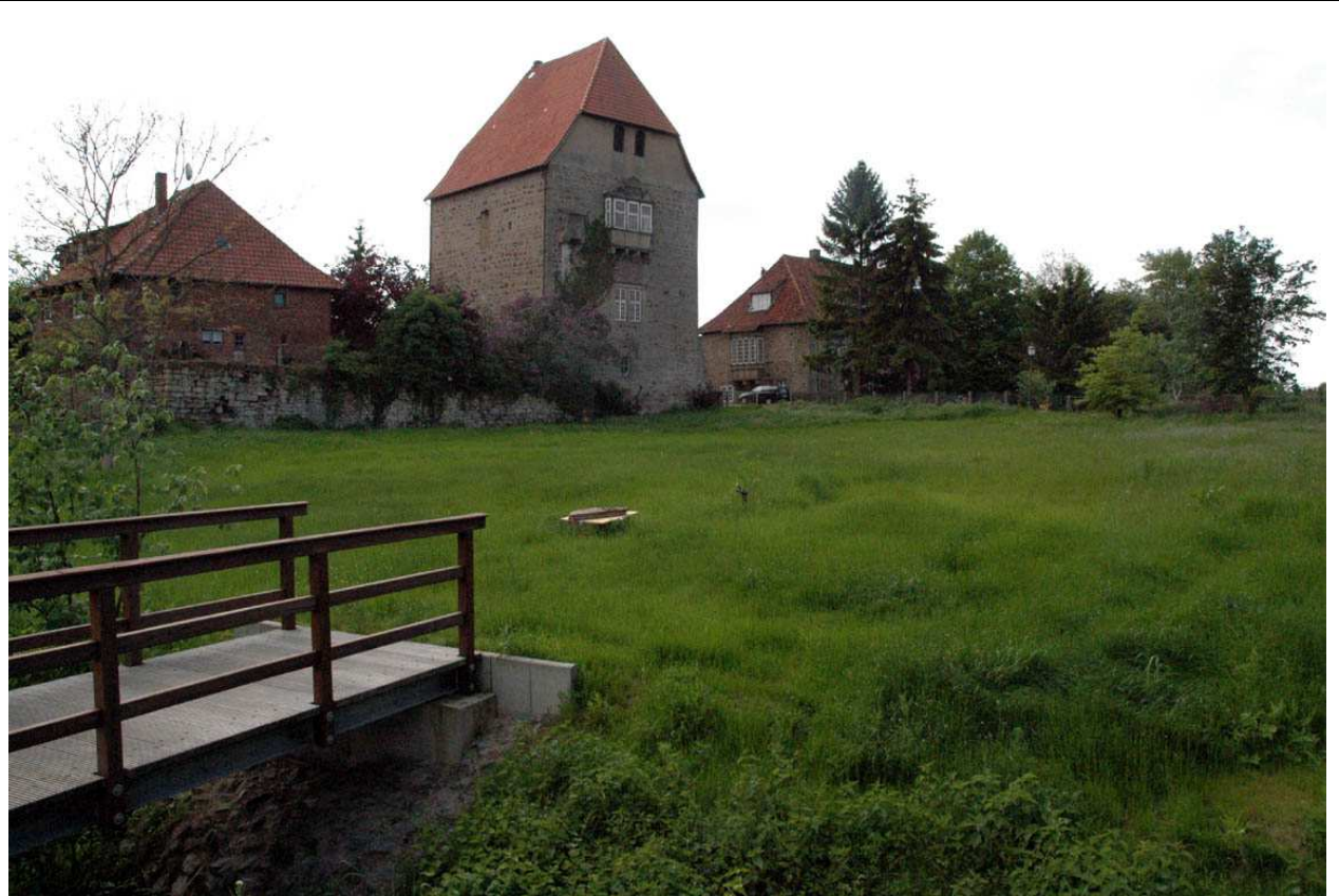
Areal des künftigen Schlossparks (Blick von Osten) vor Wohnturm und Amtshaus (rechts)