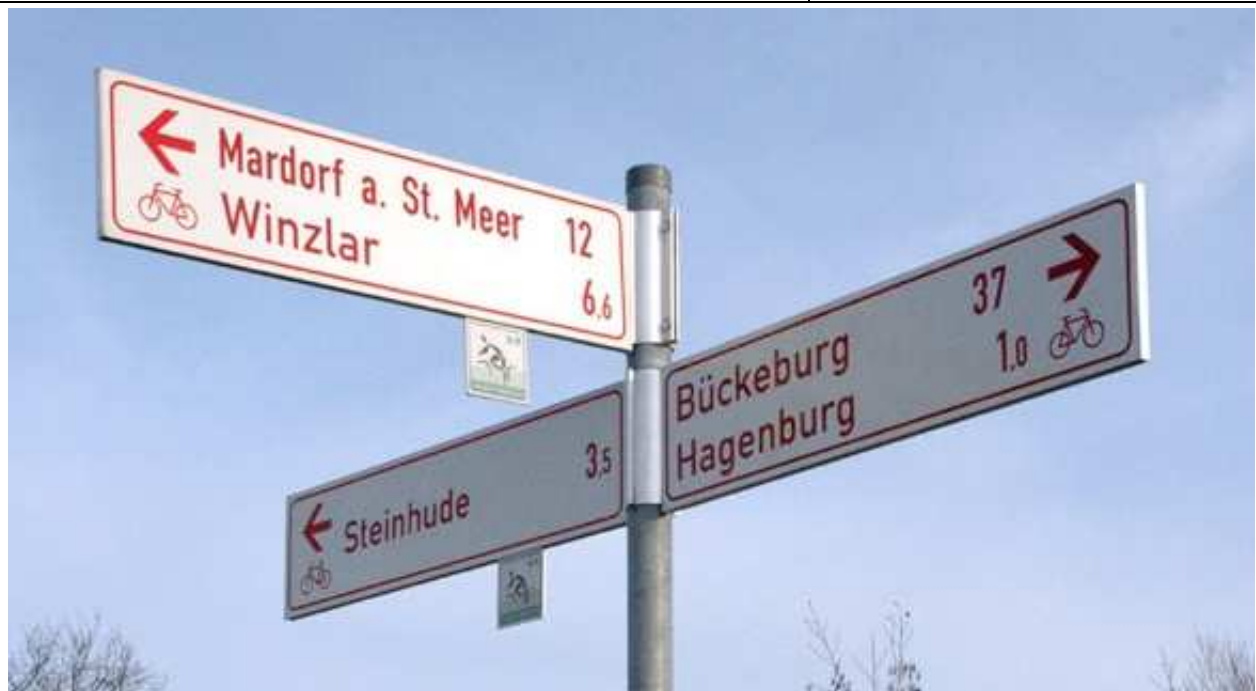
An einzelnen Standorten im Landkreis existiert bereits eine Radwegebeschilderung