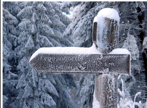
Derzeitige Ausschilderung am Deister