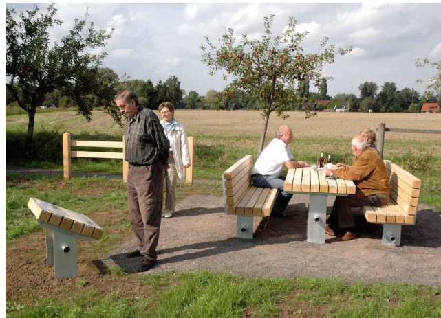
Bereits im ersten Projektabschnitt hergestellter Rastplatz mit Infopoint