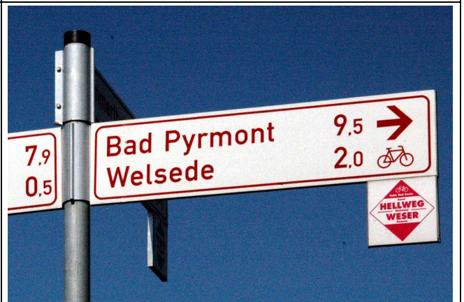
Beispiel eines Einhängeschildes an einem Zielwegweiser aus dem Landkreis Hameln-Pyrmont