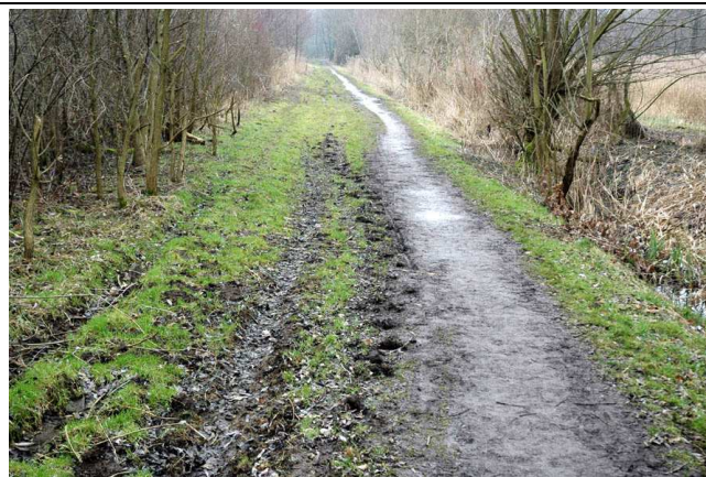
Zu verbessernder Wegeabschnitt in den Hofwiesen