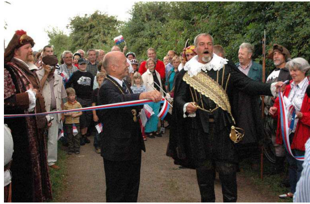
Landtour-Eröffnung durch Fürst Ernst im August 2010