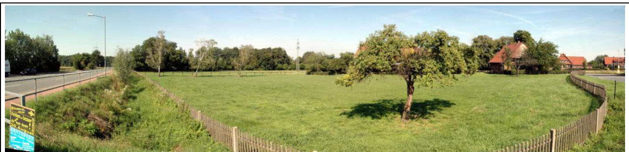
Blick nach Südwesten mit der B65 (li.) und der K 14 (re.): Entlang der Baumreihe im Hintergrund fließt der Liethbach nach Gelldorf (rechts).