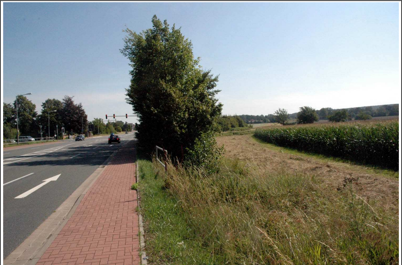
Blick nach Osten: Links die B 65. In der Bildmitte markiert das Geländer die Unterführung des Liethbaches. In der rechten Bildhälfte soll das HWS-Becken liegen. Links außerhalb des Bildes liegt Gellendorf