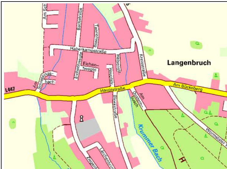
Karte (LGLN): Aus den Bückebergen kommend fließt der Helsingrundbach (hier „Krummer Bach“) durch die Wohngebiete Wendthagens.