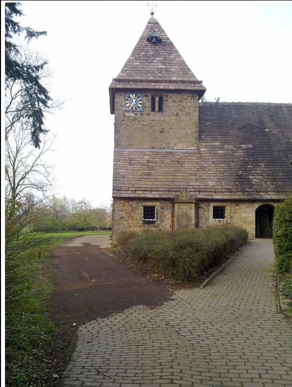
Kirchenvorplatz: aktuelle Situation (Wiegand)