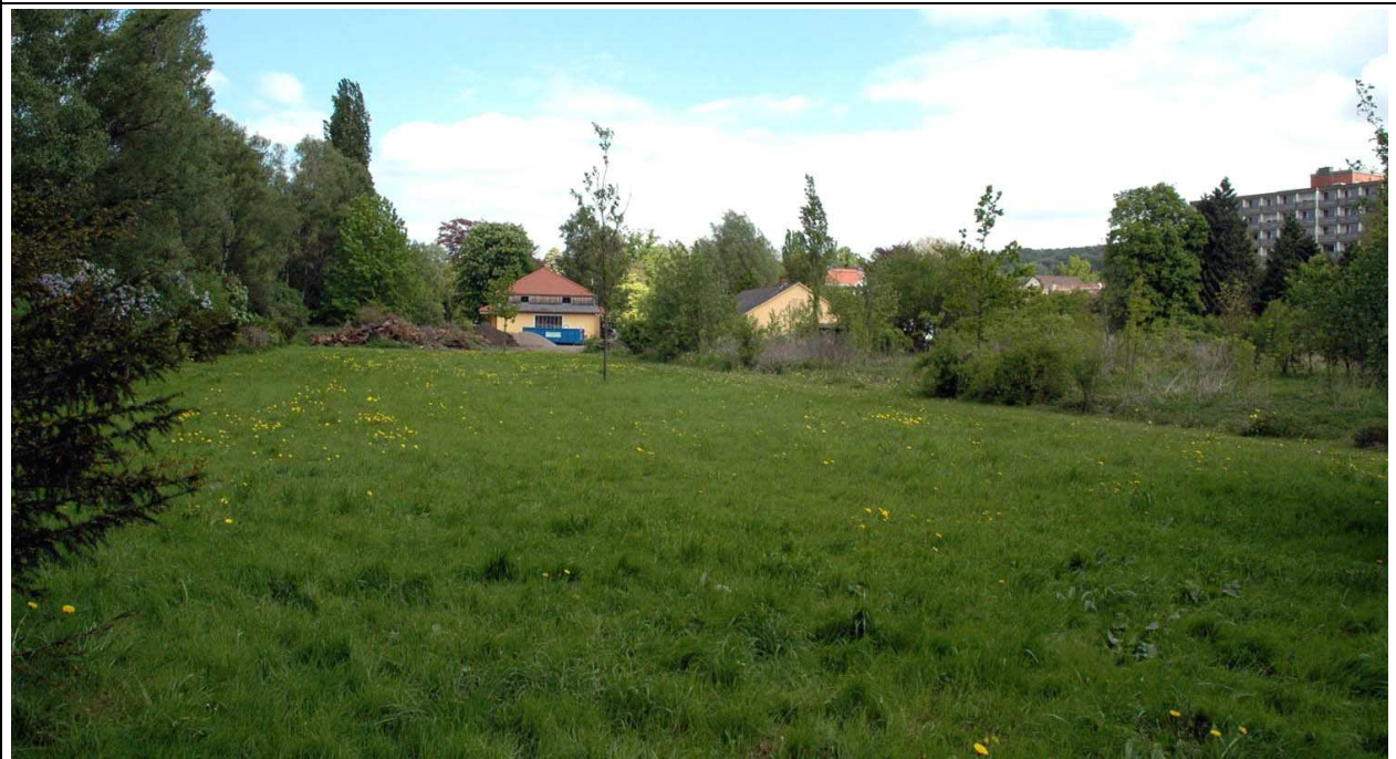
Blick von Süden in Richtung Remise: Gelände des künftigen Wohnmobilstellplatzes (Wiegand, 2011)