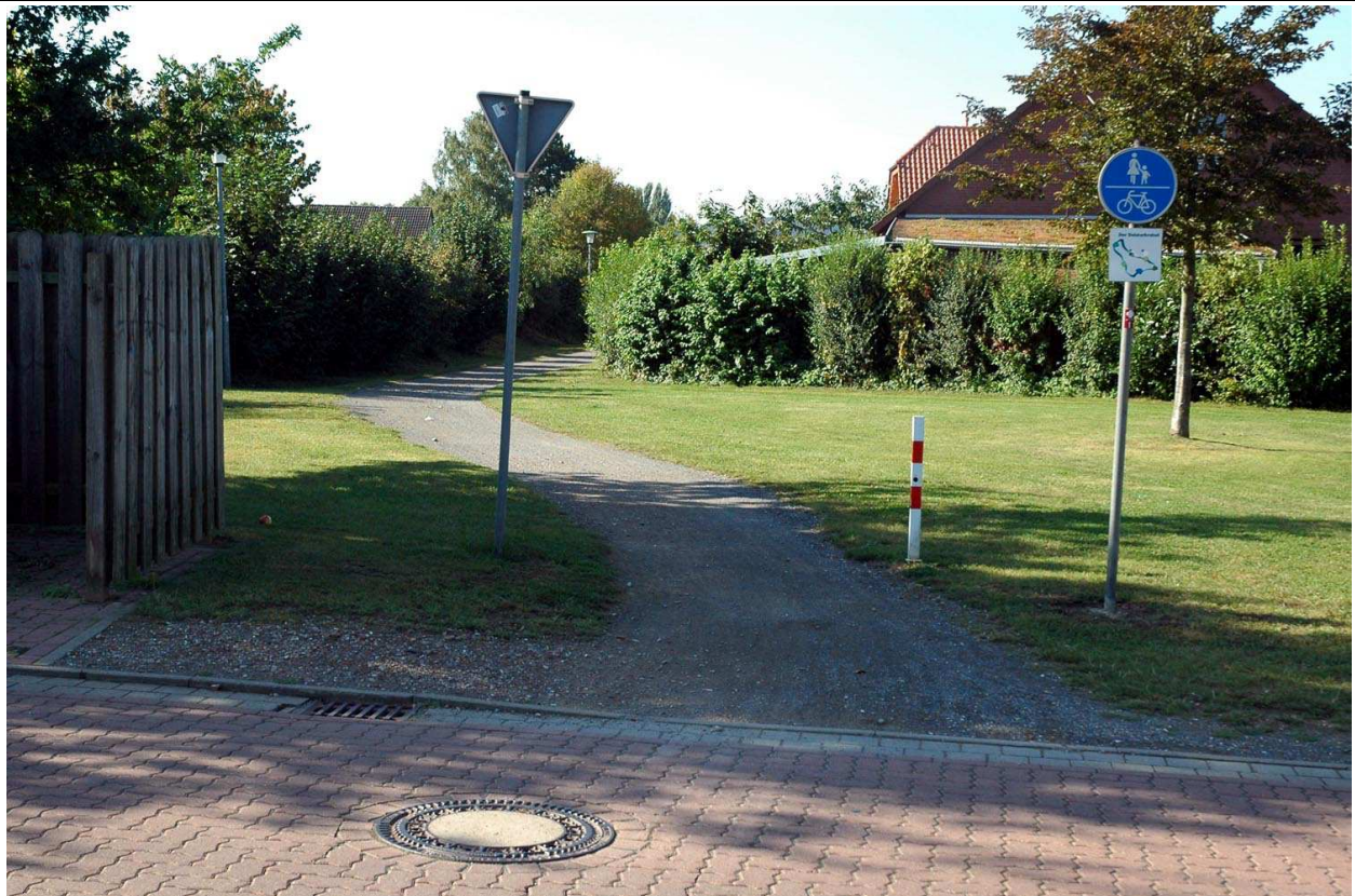
Blick von der Straße „Lehnhast“ auf den auszubauenden Radweg