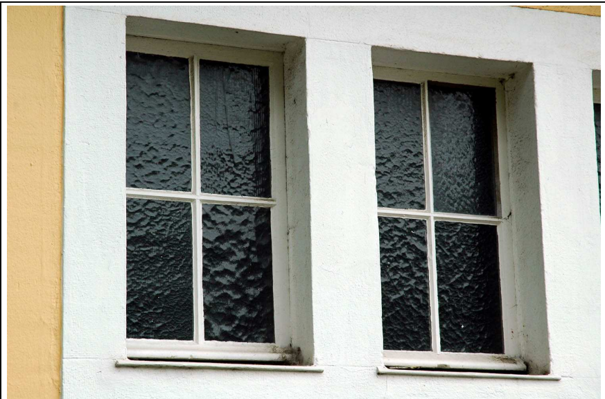
Kino, Nordseite: sanierungsbedürftige Fenster