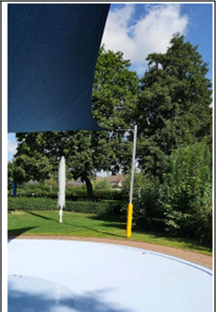
Freibad Rodenberg