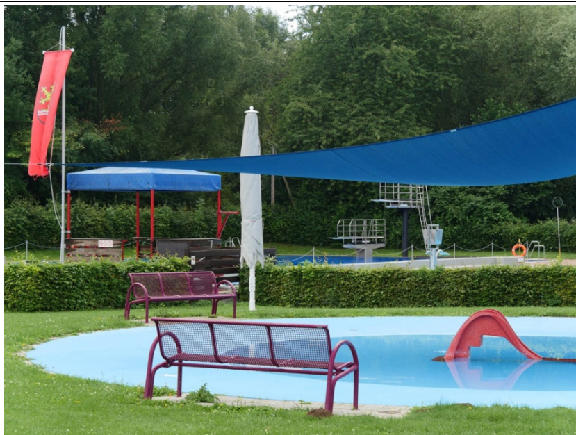
Freibad Lauenau