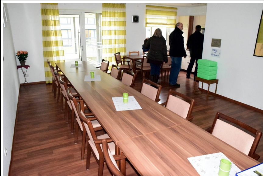
Gemeinschaftsraum im Erdgeschoss des Hauses