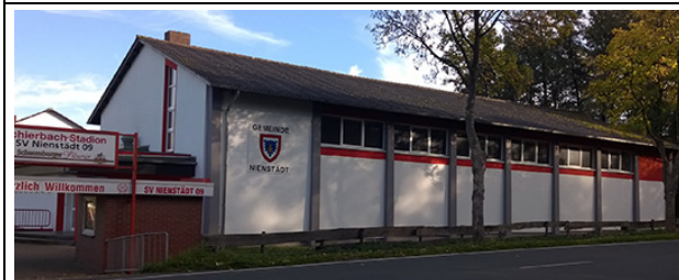
Turnhalle Nienstadt