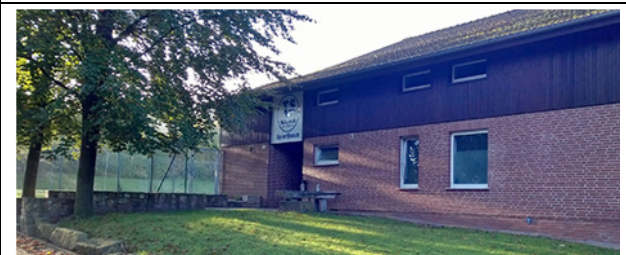
Sporthalle Sülbeck