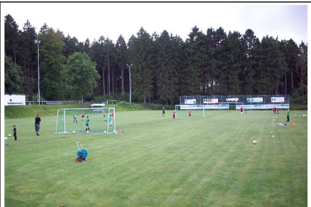
Sportanlage Liekwegen