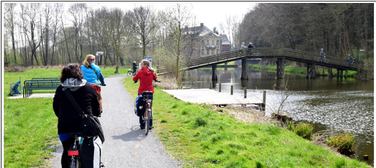
Die 19%-ige Steigung der derzeitigen Brücke zwingt viele Radfahrer zum Absteigen und Schieben. Für Rollstuhlfahrer oder weniger mobile Menschen ist sie nicht zu bewältigen.