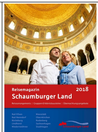
Titelblatt des Reisemagazins 2018