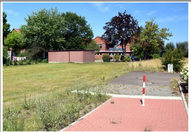
Blick vom Heringsfängerweg: Anstelle der Garagen soll die Anrufbuszentrale entstehen. Im Hintergrund die Samtgemeindeverwaltung