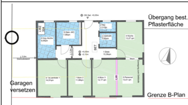
Grundriss (© Ing.-Büro Brinkmann 2018)