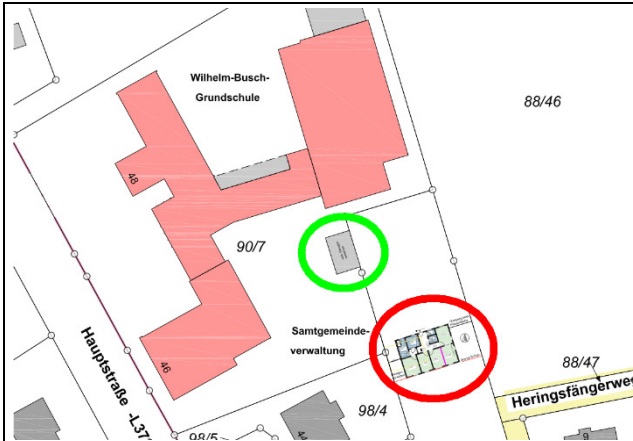
Lageplan (© Ing.-Büro Brinkmann 2018, verändert): Rot = Standort der Anrufbuszentrale Grün = neuer Standort der Garagen