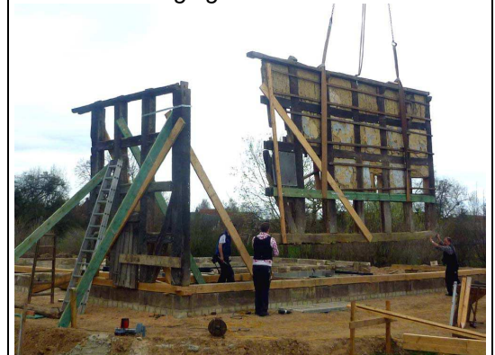
... und wurden wieder zusammengefügt.