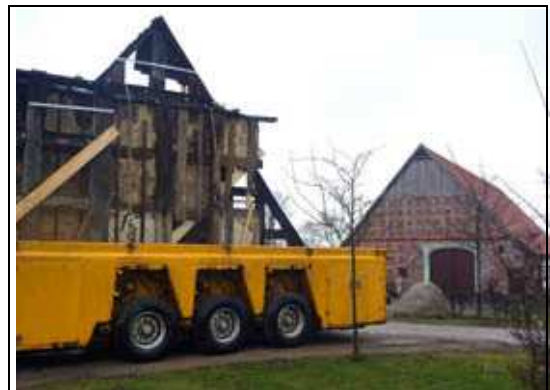
Ganze Wände gingen auf Reisen...

Das zuständige Landesamt für Denkmalpflege in Hannover hat in Aussicht gestellt, das alte Haus auch nach seiner Umsetzung wieder in den Status eines Kulturdenkmals zu erheben. Dadurch kann die Gemeinde Lauenhagen hoffen, dass sich außer Leader auch die Niedersächsische Bingo-Umweltstiftung an der Förderung beteiligen wird. Dies ist eines von mehreren Beispielen, bei denen sich die Bingo-Umweltstiftung dank des Leader-Prozesses im Schaumburger Land engagiert.