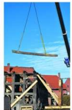
Nicht alles wird an einem Stück abgetragen. Große Balken werden einzeln heruntergehoben, während neue Streben den Rest des Hauses stützen.