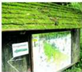
Die alten Wanderkarten wie diese am Deisterparkplatz haben noch nicht ausgedient.

Der Kostenpunkt für Rodenberg und Nenndorf: Jeweils etwa 18.750 Euro. Der Landkreis gab 10.000 Euro hinzu, aus dem Leaderprogramm flossen 15.700 Euro. Die alten Wanderkarten, die der Zweckverband Großraum Hannover einst aufgestellt hatte, bleiben übrigens stehen. gus