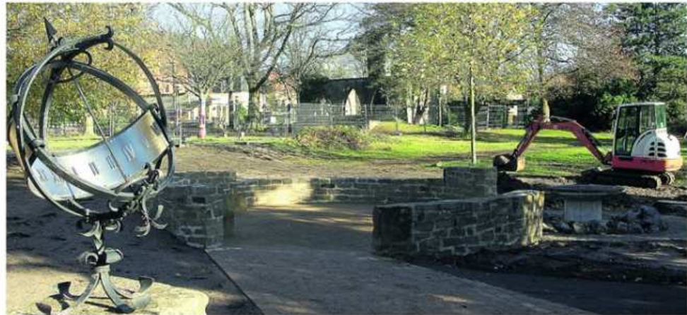
Fast fertig: Das Rondell im La-Flèche-Park. Es fehlen nur noch die Holzmöblierung, die Raseneinsaat – und natürlich die Bewegungsgeräte. tw

Derweil hat sozusagen in einem Aufwasch der Brunnen eine