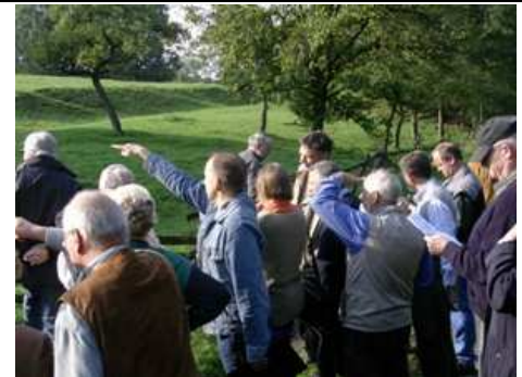
Spurensucher haben viele Gleichgesinnte – hier z.B. in Feggendorf.

Mittlerweile führt die Datenbank 1.345 Objekte. 1.130 davon sind für die Öffentlichkeit freigeschaltet und einsehbar unter http://spurensuche.schaumburgerlandschaft.de/geoportal.php in einer interaktiven Karte. 100 weitere Datensätze müssen noch redaktionell von Fachleuten geprüft werden und rund 900 Objekte warten noch auf ihre Ersteingabe. Dies alles, wie die gesamte Spurensuche selbst, basiert auf ehrenamtlichem Engagement. Der Niedersächsische Heimatbund, Initiator der „Spurensuche in Niedersachsen“, bescheinigt dem Schaumburger Land eine „beispiellose Vorreiterrolle“ für ganz Niedersachsen. Und das nächste Projekt haben die Spurensucher/innen schon begonnen: In einer weiteren Datenbank dokumentieren und erhalten sie das Schaumburger Platt in all seinen lokalen Facetten.