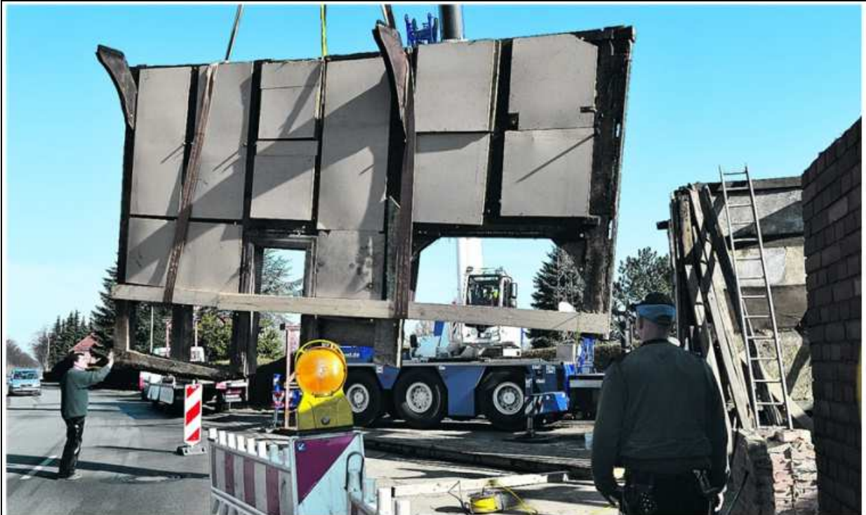
Behutsam arbeiten der Kranfahrer und die Zimmermänner bei dem Abbau zusammen, damit die Fachwerkhause-Wand unbeschadet auf der Stahl-Palette landet.

Zum Leader-Projekt „Hülshagen 1“ (Schaumburger Nachrichten, 07.03.2013):